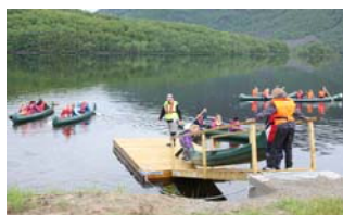
Brygga i Ørsdalen og kanobrygga ved Esso