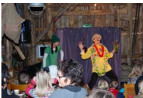
Julebarneteater på Pittergarden 2. desember