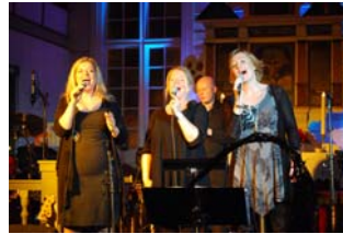
Konsert Musical Treatment i Bjerkreim kyrkje 9. desember og Skrimmel Skrammel-konsert på Vikeså skule 22. mai