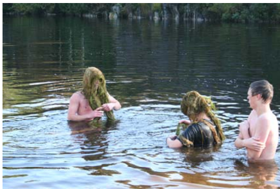
Bli-kjent-turen til ungdomstrinnet