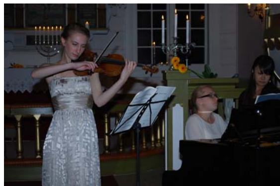
Kammerkonsert i Bjerkreim kyrkje 27. september