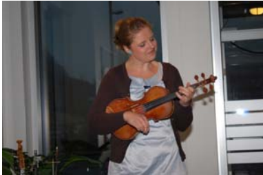
Tindra-konsert 5. april i inngangspartiet på kommunehuset