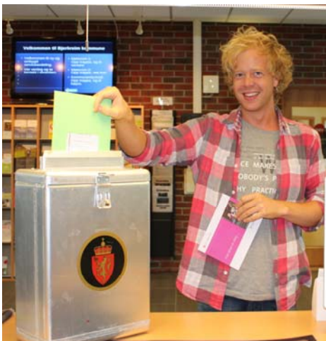
Forhåndsstemming i serviceavdelingen

I januar tok vi i bruk de nye, ombygde lokalene for serviceavdelingen og det nye inngangspartiet på kommunehuset. Vi er kjempefornøyde, og har fått mye positiv respons fra publikum!