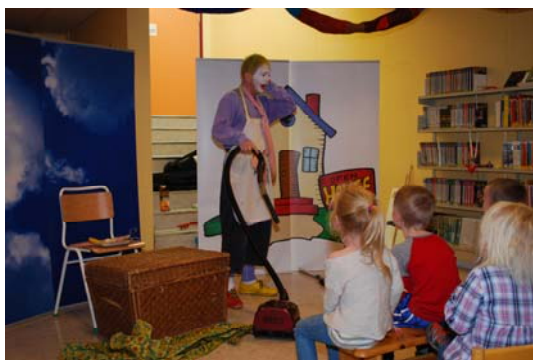
Mamsepapsen på biblioteket 12. november

Besøkstallet sank med ca 5 000 fra 2010 til 2011, til 8 600. Etter at biblioteket hadde vært stengt og delvis stengt, tok det tid før lånerne igjen var kommet inn i "vanen" med å gå på biblioteket.