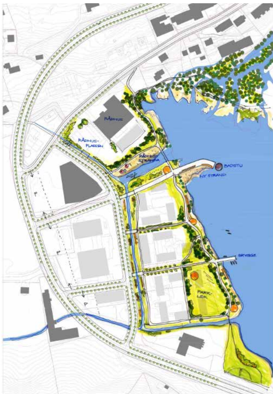
3RW Dronninga landskap

https://www.bjerkreim.kommune.no/aktuelt/sentrumsutvikling-vikesa-midtveis.110279.aspx