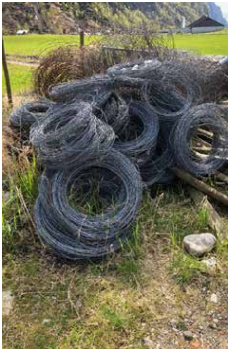
I Orsdalen har Morten Vassbø gjort ein stor jobb med fjerning av piggråd 😊